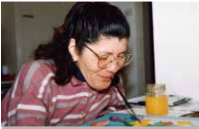
作者 ローズマリー・ウェバー（スイス/口で描いた画家）

「口と足で描く芸術家協会」は、1956年創設以来、「Self Help Not Charity－慈善ではなく自立」をモットーに世界中の障がい者の皆様に支援しています。親切会は2001年以降四半世紀にわたり、この会を支援しています。親切会 HP には他の作品も掲載していますので、ぜひ、ご覧下さい。