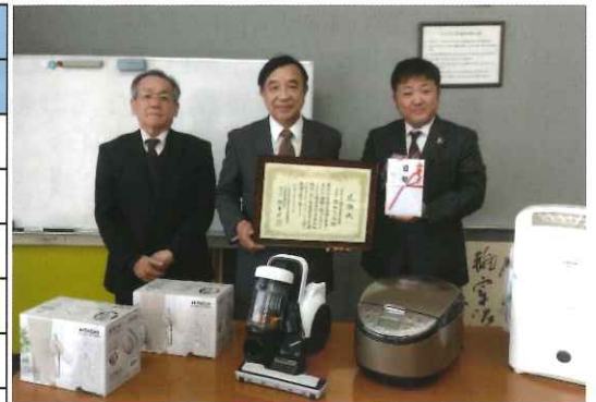
福島県代表施設の福島愛育園にて