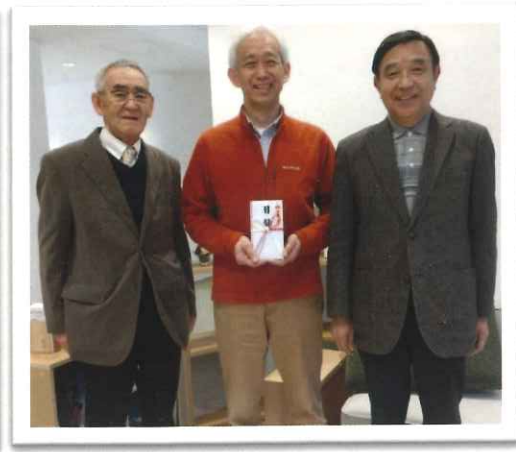
日本盲導犬協会賛助会員証と仙台訓練センターにて目録贈呈