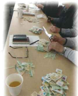
日立仙台OB会の整理支援

(株)東北日立福島支店 (株)中北電機 (株)ニッセイコム東日本支社東北支店 日立グローバルライフソリューションズ(株) ホームソリューションズ事業部国内営業本部北日本エリア統括 日立建機日本(株)東北支社 (株)日立建機カミーノ (株)日立製作所東北支社 東北総務部 (株)日立情報通信エンジニアリング北日本オフィス東北エリア (株)日立プラントサービス東北支店 マクセルフロンティア(株)米沢事業所 三菱HCキャピタル(株) 三和電機商事(株) (株)山一地所本社 (株)ゆうちょ銀行仙台貯金事務センター