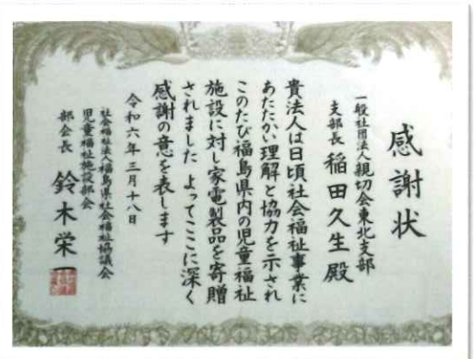
福島県社会福祉協議会様から感謝状を頂きました