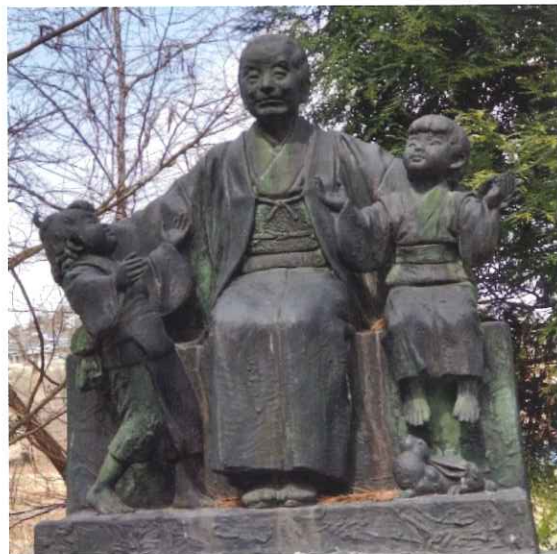
寄贈先 福島愛育園創立者「瓜生岩子氏像」1893 年創立(うりゆういわこ)氏は日本のナイチンゲールとも称され、実業家洪沢栄一氏から要請を受け同様な施設「東京養育院」へ赴任支援を行っており、のちの明治34年に浅草寺(東京)の境内に銅像が建立されその除幕式に洪沢栄一氏が列席されたといわれています。