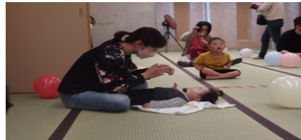
(ベビーマッサージの状況)