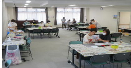
(障害児による絵画の創作中風景)