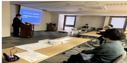
(オンライン医療講演会の会場風景)