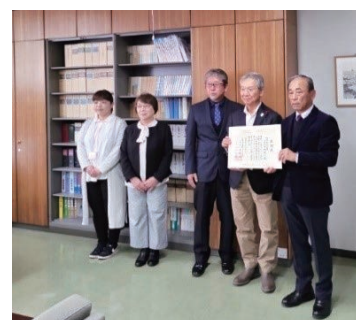
三重ボランティア基金