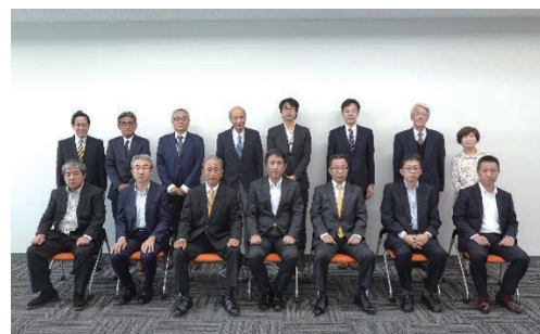
(株)日立製作所中部支社セミナールーム

また、昨今の最重要課題であります『会員の拡大』に対しまして、久しぶりの昼食会を挟みながら、意を新たに強力に取り組んでいくことを確認しました。