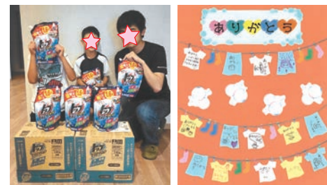
クローバーライト

2023年6月下旬、今年度で17回目となる洗剤寄贈を、東海4県の児童養護施設・乳児院合わせて93施設に行いました。寄贈先から、子供たちは毎日元気に動き回り直ぐに服を汚してしまうので、洗剤の寄贈は本当に嬉しいと感謝されています。職員の方々や子供達から、沢山の謝礼のお手紙や絵をいただきました。