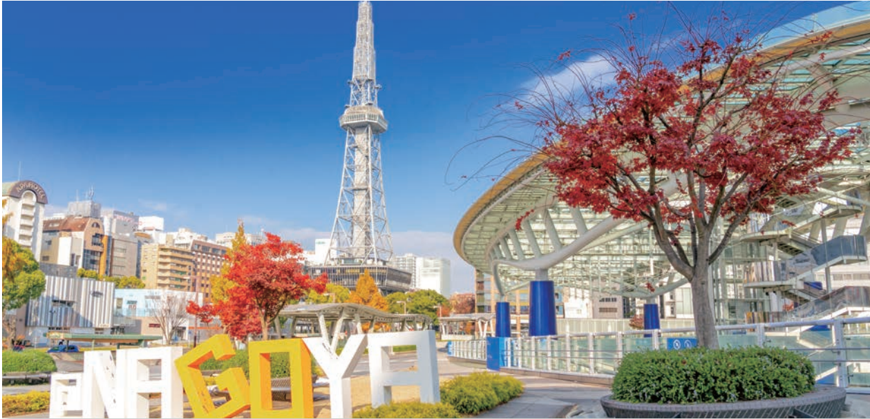
名古屋市 久屋大通公園「中部電力MIRAI TOWER」

●●● 「親切会」とは、あなたの「善意」を、世の中に広げる「ボランティア」の窓口です ●●●