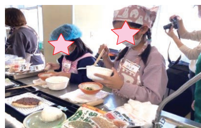
わいわい子ども食堂

愛知県内の子ども食堂の過半が加盟する「同NWK」に、2023年11月に寄付金を委託しました。寄付金の委託は4年目を迎えますが、コロナ感染が一段落し、多くの子ども食堂が対面式で再開されており、貴重な活動資金として子ども食堂の運営者に分配されています。