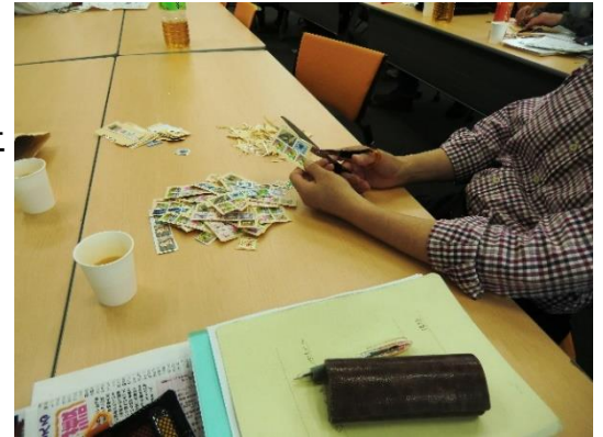
（日立仙台OB会例会での様子）

・日立仙台OB会の皆様には、使用済み切手の台紙を適正なサイズに切り取る作業を継続的にご協力頂いております。