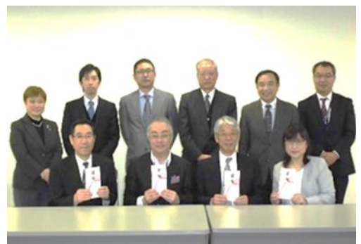
(於：青森市内 県民福祉プラザ)