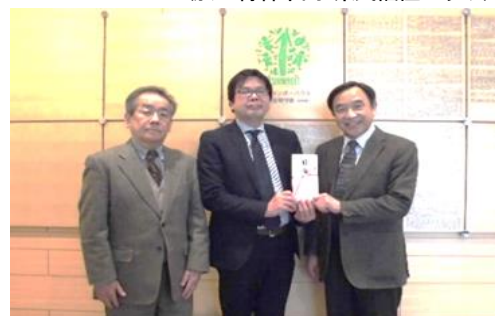
(於：仙台市内 あしなが育英会)