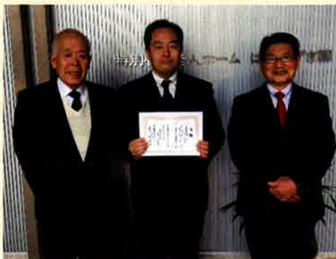
はなみずき園 川崎施設長