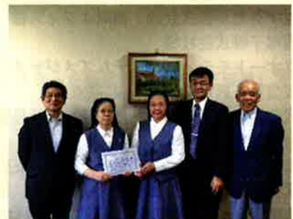
聖嬰会 平野施設長