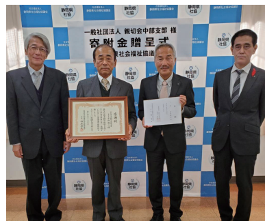
於：静岡県社会福祉協議会

9月23日夜～24日未明にかけて静岡県を襲った台風15号は、県内5地点で観測史上最大の雨量を記録し、死者3名、家屋全半壊2,304棟、床上浸水5,658棟という被害をもたらしました。また、静岡市清水区では63,000戸に及ぶ大規模な断水が発生し、約2週間に亘って給水が実施されました。更に、送電鉄塔の倒壊により静岡市を中心に2日間に亘り約11万3,900戸で大規模な停電が発生しました。親切会中部支部としては、初めて災害義援金の支給を決定し、11月24日に静岡県社会福祉協議会を訪問、30万円を寄付いたしました。尚、10月28日には、国から静岡県に対し激甚災害の適用が決定されました。