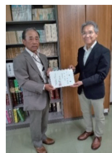
三重ボランティア基金