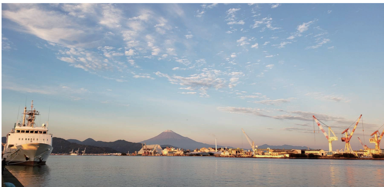
海洋研修船に船ドックの昔を偲ぶ富士の山 撮影:上藪芳朗(清水港より)