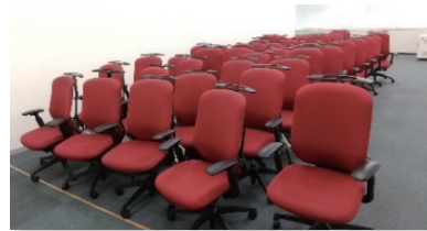
日立製作所の肘掛け椅子

7・8月、(株)日立製作所中部支社様の事務所移転、(株)日立産機システム中部支社様の事務所内レイアウト変更により余剰となった備品(肘掛け椅子 41脚、机椅子 4セット)の寄贈を受け、名古屋市内児童養護施設と連携、9月7日、5施設に斡旋配送いたしました。