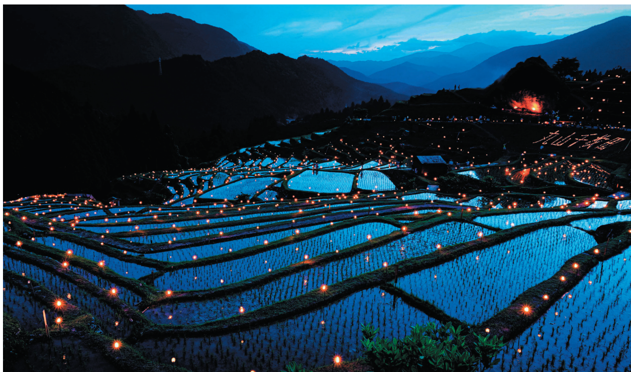
三重県熊野市紀和町 「丸山千枚田での虫送り」