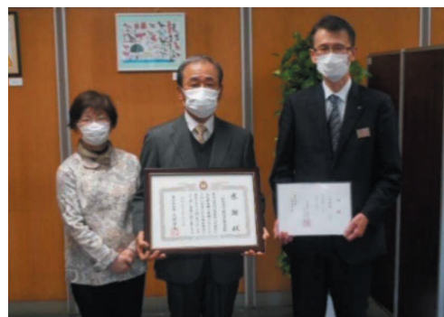
愛知県福祉局において