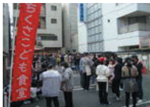
子ども食堂での食材・弁当配布

2017年度より、名古屋市内に開設の子ども食堂延べ40ヶ所に寄付金を贈呈してまいりましたが、コロナ禍により現在は多くの子ども食堂が運営を休止しております。一方でそのような状況下においても、食材や弁当の配布型に切り替え継続し運営されている子ども食堂もあり、2021年2月愛知県内175ヶ所のうち90ヶ所が加盟する「あいち子ども食堂ネットワーク」を通じ寄付金を委託し、運営されておられる子ども食堂に有効活用いただく事としました。委託金は、他所からの寄付と併せ5月に加盟する県内73ヶ所に配分されております。