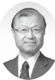
一般社団法人 親切会会長